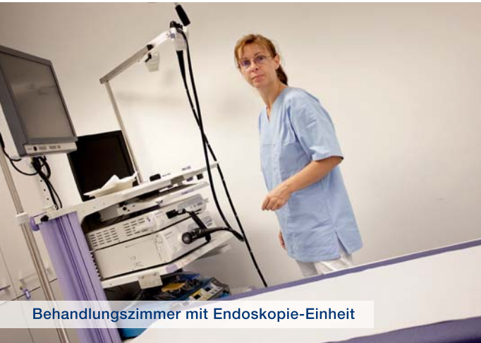
Behandlungszimmer mit Endoskopie-Einheit