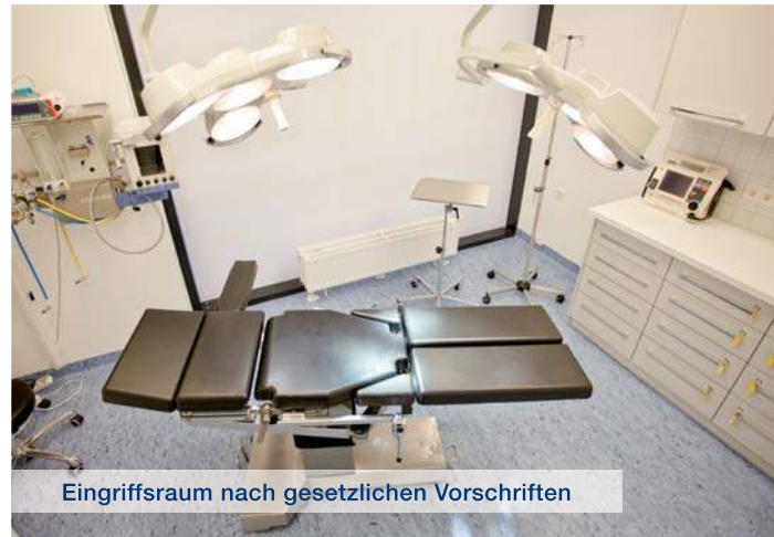
Eingriffsraum nach gesetzlichen Vorschriften