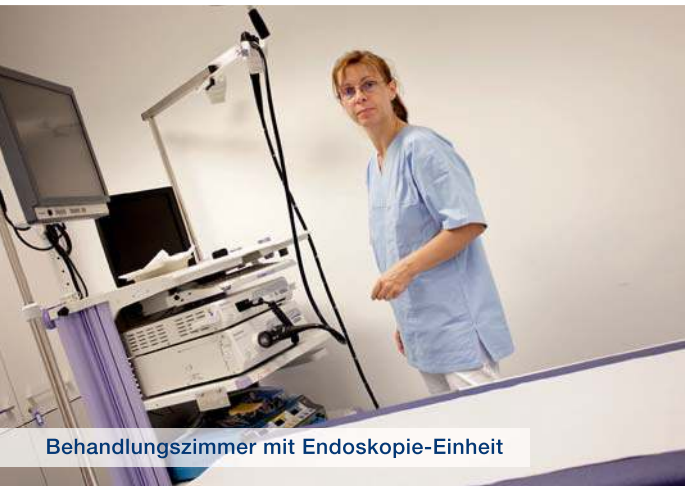
Behandlungszimmer mit Endoskopie-Einheit