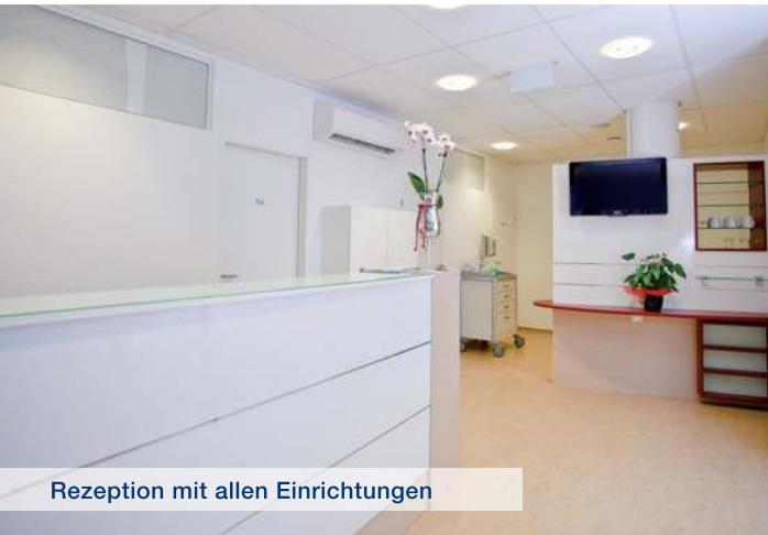
Rezeption mit allen Einrichtungen